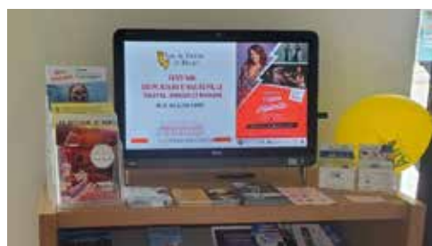
Bureau de Plateau d'Hauteville

Nos trois bureaux d'accueil sont équipés d'écrans qui diffusent des vidéos touristiques à thème et saisonnières. Ces écrans sont disponibles pour afficher la publicité de votre choix.