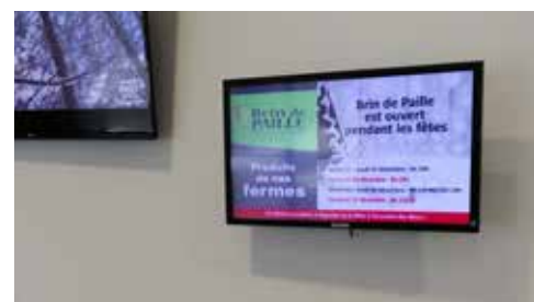
Bureau de Nantua